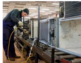
Anlage für Kühlgeräte