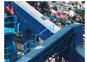
Shredder für Automobil und Konsumgüter