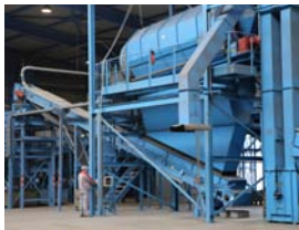
Anlage für Elektro(nik)-kleingeräte