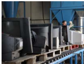
Teilautomatisierte Aufbereitung von TV-Geräten